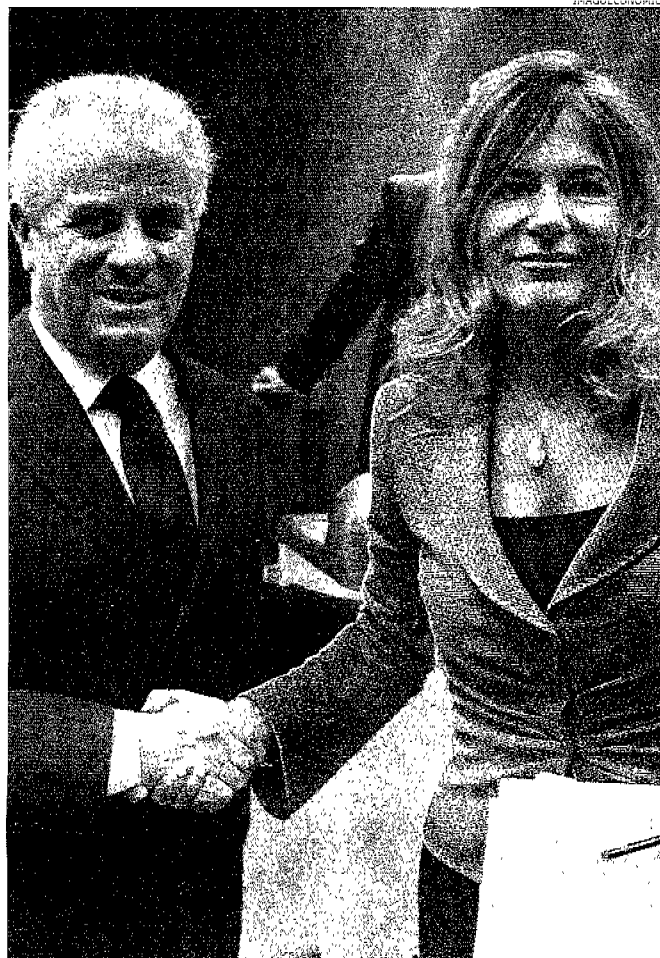
Per il «made in Italy». Il ministro dello sviluppo economico Claudio Scajola e la presidente di Confindustria Emma Marcegaglia